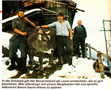
In der Schweiz gilt der Bauernstand als «over protected», als zu gut beschützt. Wer allerdings mit einem Bergbauern bei uns spricht, bekommt davon kaum etwas zu spüren.

Ziel der Zusammenarbeit in beiden Ländern ist die Ausbildung und Stärkung von Strukturen mit langfristig wirkenden Massnahmen, welche die Ge-