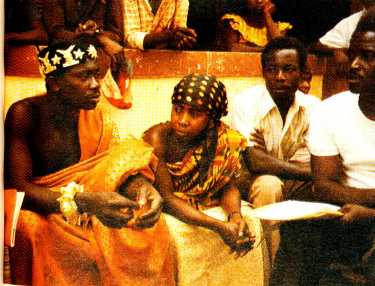
Der Dorfhof von Ananekrom in der Ashanti-Region von Ghana ist die Respektsperson der Dorfgemeinschaft. Auch hier fallen die Bauern durch alle sozialen Netze. Sie sind nicht geschützt.

Auch Ghana ist in den letzten Jahren nicht von katastrophalen Ereignissen verschont geblieben. Man erinnere sich an die Rückwanderung von Hunderttausenden von Ghanern aus Nigeria sowie an die Hungersituation 1982 und 1983. Diese Ereignisse haben das Rote Kreuz veranlasst, ein Katastrophenvorsorgeprogramm im ganzen Land aufzubauen und die regionalen Vertretungen mit Lagermöglichkeiten von Hilfsgütern und mit Transportmitteln auszustatten, was ein schnelles Eingreifen der lokalen Rotkreuzfreiwilligen bei Not Situationen ermöglicht.