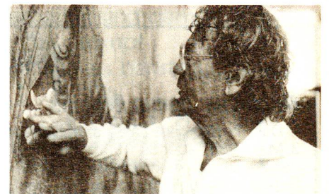
29 Panta Rhei – Alles fliesst Künstlerporträt Hans Erni