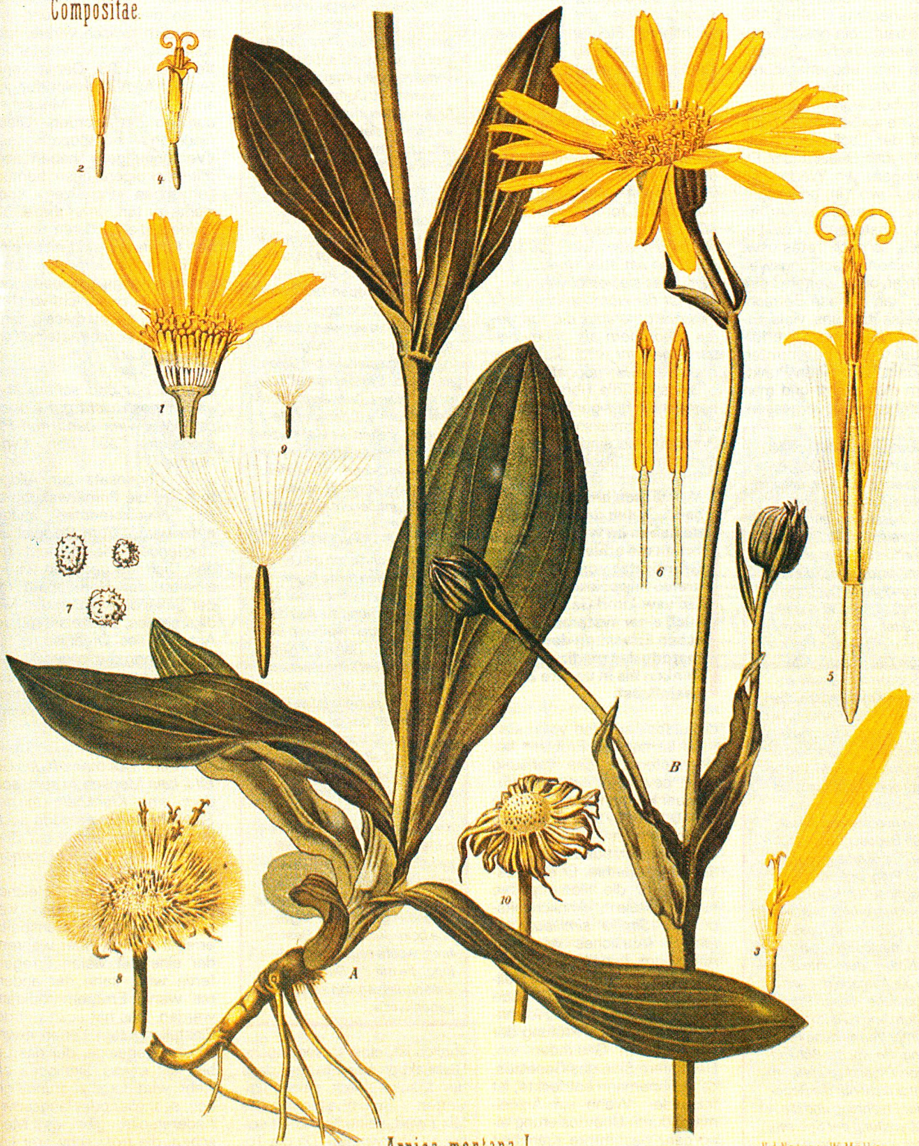
Arnica montana L.