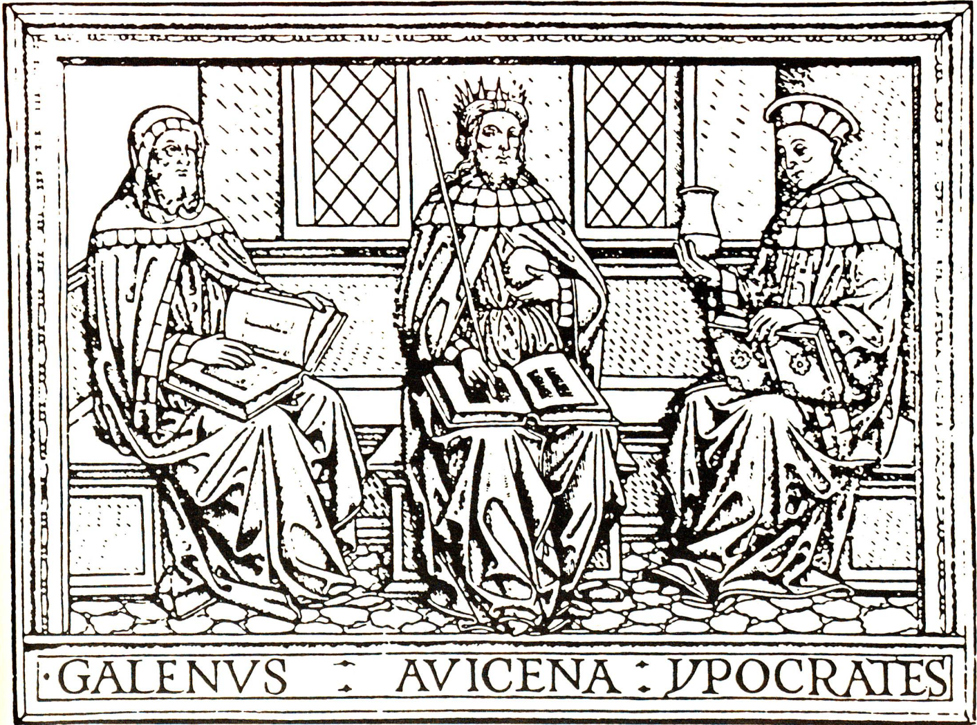
Galen, Avicenna, Hippokrates Holzschnitt aus einer gedruckten Ausgabe des Kanons von Avicenna, Pavia 1510.