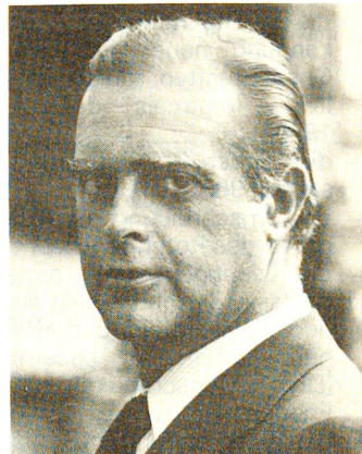
Enrique de la Mata (1933), Spanier

Generalsekretär der Liga der Rotkreuz- und Rothalbmondgesellschaften. Ehemaliger Minister während der ersten Regierungszeit von Suarez. Verheiratet. Vater von sieben Kindern.