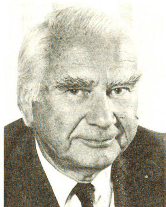
Alexandre Hay (1919), Schweizer

Seine private Seite: Glühender Verfechter arabischer Kultur, der Geschichte Jordaniens und – Blumenfreund. In seinem Haus in Jordanien befindet sich eine einmalige Sammlung jordanischer Pflanzen.