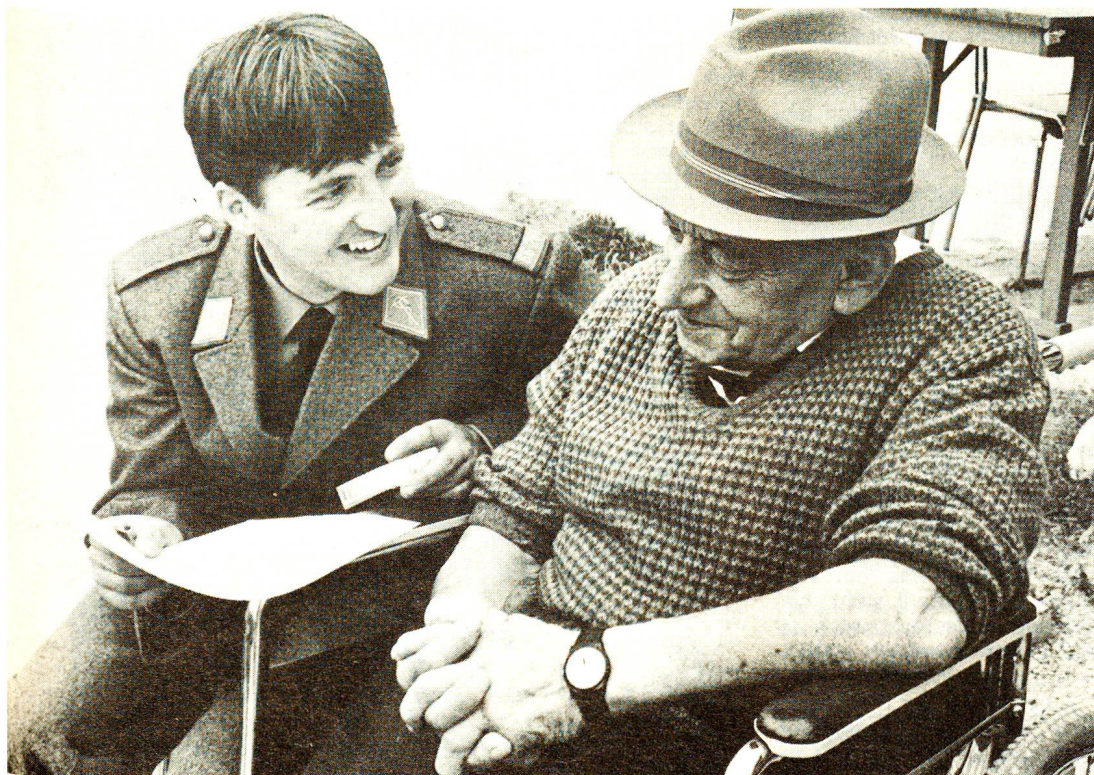
Der alte Senn, der noch bei allen Freiburger Liedern mitsang, hat erkannt, dass das Leben nie alles auf einmal bietet. «Es geschieht hintereinander», philosophierte er. «Zuerst war ich Senn und ohne Frau. Und heute bin ich im Altersheim von vielen Frauen liebevoll umgeben...»

Mir schien, als hätte es an diesem Tag keine Verlierer gegeben. Nicht auszumachen, wer abends zufriedener war, die Gäste oder jene, die für die Gäste den Reichtum ihres Herzens eingesetzt hatten. □