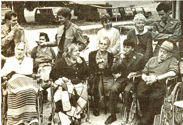
Die jungen Männer der Sanitätsrekrutenschule in Moudon holten nicht nur die Betagten aus ihren vier Wänden oder den Heimen heraus, sie umsorgten sie auch fürsorglich den ganzen, langen Tag und führten sie abends wieder nach Hause.

Sie, die zierliche alte Dame, erzählte mir, dass das Leben früher in der Basse-Ville von Freiburg viel lustiger und lebendiger gewesen sei; damals, als die Leute noch nicht so viel Geld besaßen wie heute. «Alt werden ist schön», sinnierte sie, «nur müsste man gesundbleiben können.»