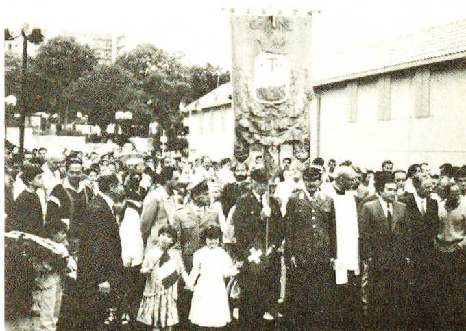
Die Einweihung der Wohnsiedlung weitete sich zu einem regelrechten Volksfest aus.

Insgesamt hatte das Erdbeben vom 23. November 1980 3000 Tote, 8000 Verletzte und über 300 000 Obdachlose gefordert. Für die Nothilfe sowie für den Wiederaufbau hat das SRK bisher über 10 Mio. Franken eingesetzt. □