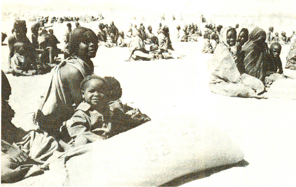
Nahrungsmittelverteilungen in Dougin, Mai 1985. Geduldiges Warten, unsichere Zukunft.

gegebenenfalls die Ausbildung von Samaritern vor. Ob eine solch punktuelle Hilfe langfristig erfolgversprechend auf die Gesundheitsversorgung wirken würde, war äusserst fraglich: In der Projektregion Biltine fehlt es an allem, das gesamte Umfeld, das Samariterarbeit sinnvoll macht, fehlt; weder die Dispensarien der Region noch das kleine Spital von Biltine sind gerüstet, um Samaritern die nötige Unterstützung und Hilfe zu geben, ihre Arbeit auszuführen. Schulung, Begleitung, Versorgung mit Verbandsmaterial, nichts ist gewährleistet. Die Gespräche mit den tschadischen Gesundheitsbehörden ergaben, dass landesweit eine Kampagne zur Verbesserung der Gesundheitsversorgung an der Peripherie gestartet werden sollte, doch dass einerseits die staatlichen Strukturen noch nicht genügend gefestigt sind und andererseits die Mittel fehlen, um dieses Programm mit dem erforderlichen Nachdruck einzuführen.