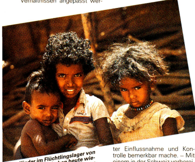
Kinder im Flüchtlingslager von Wad Sherife haben heute wieder ein Zukunft. Sie sehen gesund und wohlgenährt aus.

Die das Flüchtlingslager umgebenden Dörfer machen einen armen Eindruck. Die Leute leben zwar an ihrem angestammten Ort, und innen stehen theoretisch alle Türen offen, aber was sie für das tägliche Leben brauchen, reicht an allen Ecken und Enden nicht aus. Es hat zu wenig Wasser, zu wenig Nahrung, zu wenig Vieh, zu wenig Medikamente,