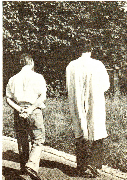
Wie weit soll der Patient aufgeklärt werden?