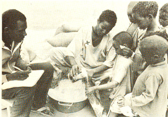
Die Abteilung Auslandhilfe (neu: Internationale Zusammenarbeit) des Schweizerischen Roten Kreuzes hat als Attraktion Nomaden- und Flüchtlingszelte aus ihren Einsätzen mitgebracht. Die Delegierten stehen für jede Diskussion zur Verfügung.

Im Zeichen des Roten Kreuzes: RETTEN, HELFEN, AUSBILDEN