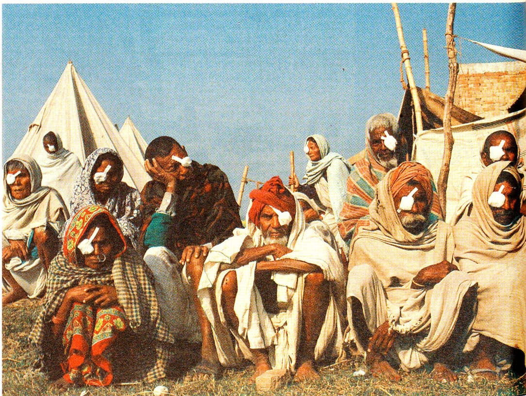
Unzähligen Menschen mit schweren Augenleiden kann durch das augenärztliche Projekt des SRK geholfen werden. Wenn die ambulante Equipe unterwegs ist, kommen Hunderte von Menschen aus weit abgelegenen Dörfern in den Bergen ins «Lazarett», um sich helfen zu lassen.

«Diese Restkosten für den Spitalbau müssen wir selbst übernehmen. Ich werde mich darum kümmern und suche das Geld hier. Wie lange können wir auf ausländische Hilfe zurückgreifen? Wir sollten doch nicht immer euch um Unterstützung bitten. Wenn wir nicht bald etwas in die Wege leiten, werden wir nie unabhängig sein.» Dies ist eine der vielen träfen und manchmal