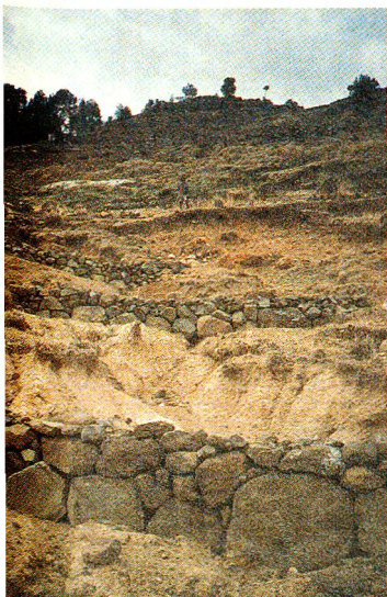
Im Rahmen des «Arbeit-für-Nahrung»-Programms wurden diese Kontrolldämme gebaut. Sie sind ein wichtiger Erosionsschutz.

heitlichen ländlichen Entwicklungsprojektes einen langfristigen direkten Beitrag in der Katastrophenvorsorge zu leisten. □