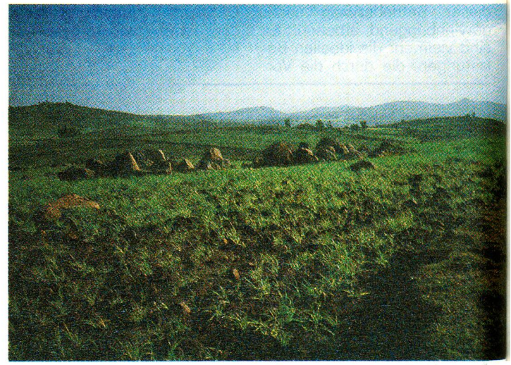
August 1985: Überall grünte es – doch zum Anpflanzen fehlten sämtliche Mittel.

hilfeaktionen des Internationalen Komitees vom Roten Kreuz (IKRK) in den Konfliktzonen Äthiopiens und die Hilfsprogramme des Äthiopischen Roten Kreuzes in den Dürregebieten unterstützt, ist indessen überzeugt, dass die Entwicklung in diesem Land weiterhin verfolgt werden muss. Noch ist die Not der äthiopischen Bauern und Nomaden nicht beseitigt. Pessimisten schliessen eine neue Katastro-