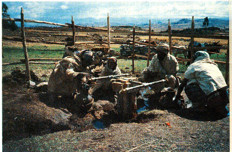
Quellenschutz als Voraussetzung für sauberes Wasser. Massnahmen zur Förderung der Basisgesundheitsversorgung stehen künftig im Vordergrund.

Im Zeichen der stärkeren Bewusstseinsbildung stehen auch die gegenwärtigen Abklärungen des SRK. Gezielt soll künftig die Basisgesundheitsversorgung in der Region gefördert werden. Gesundheit, wie sie unserer Ansicht nach angestrebt werden soll, zielt nicht in erster Linie auf die Heilung ausgebrochener Krankheiten ab. Viele, ja die meisten Krankheiten können mit wenigen Vorsichtsmassnahmen verhindert werden. Der Schutz des Trinkwassers zum Beispiel verhindert Durchfallerkrankungen, Typhus und die oft tödliche Cholera. Zum Wasserschutz sind nur einfache Massnahmen, Disziplin und Verständnis nötig, doch fehlt oft das Bewusstsein dafür. Wasserschutz ist Sache eines jeden einzelnen der Dorfgemeinschaft – hier und mit ähnlichen Vorsorgemassnahmen will das SRK künftig ansetzen, um als Teil eines ganz-