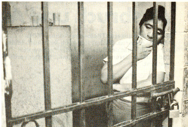
«Für jene, die gefoltert werden, ist die Befürchtung besonders quälend, dass niemand davon weiss.» Zitat aus der Broschüre «Schweizerisches Komitee gegen die Folter».

Bleibt schliesslich die Frage, wie sich das IKRK zu den Bemühungen und zum Vorgehen