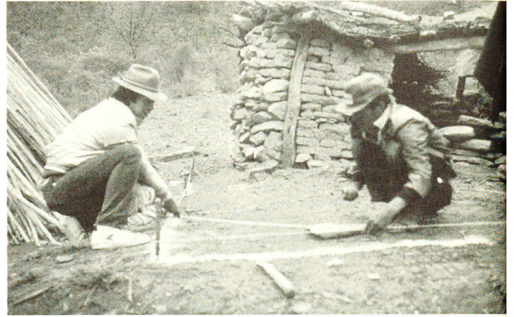
Unter Anleitung und mit lokalen Materialien werden erste Schritte zur Sanierung der Wohnstätten unternommen.

Und die Bekämpfung der Vinchucas? An einem Seminar in Redención Pampa vom vergangenen März, das sich neben vielen anderen Themen