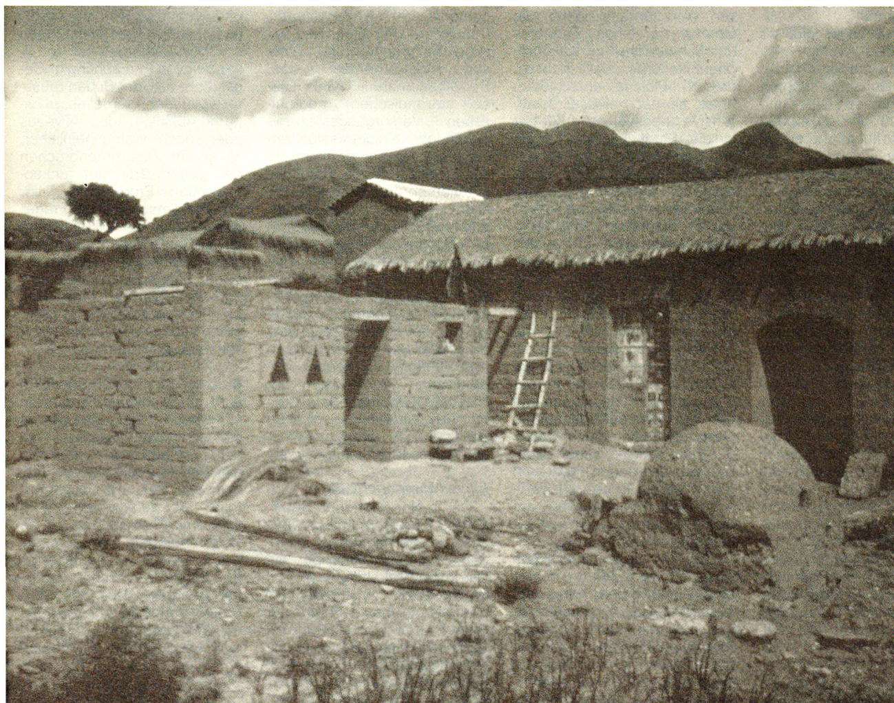
Einige Bauern ergreifen selbst die Initiative zu baulichen Verbesserungen. Zum Beispiel indem sie die Ritzen unter dem Strohdach, wo sich die Vinchucas mit Vorliebe einnisten, mit Verputz verschliessen.

Durch die Arbeit der beiden Studenten erhalten viele Bauern praktischen Anschauungsunterricht. Falls er Früchte trägt und es zu systematischen architektonischen Veränderungen kommt, könnte dies zusammen mit anderen Faktoren dazu führen, dass die Bauern des Tales eines Tages wieder ruhig in ihren Häusern schlafen können und hier wie in der Pampa eine Generation heranwächst, die sich vor der Chagas-Krankheit nicht mehr zu fürchten braucht. □