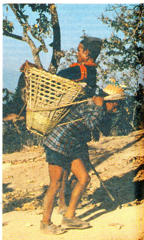
Unterwegs zum «Eye Camp»...

vier Stunden. Ein glücklicher Patient wohnt nur zehn Minuten vor temporären Operationssaal entfernt; eine alte Frau hat einen zweitägigen Fussmarsch hinter sich. Die meisten Patienten kamen zu Fuss, zwei Dutzend auf einem Büffel-Karren; einige wenige konnten öffentliche Verkehrsmittel benutzen. Auf ihrem Weg und während der Zeit im «Eye Camp» werden die Patienten von einem oder mehreren Verwandten oder guten Bekannten begleitet. Oft müssen die Blinden an einem Stock durch die unwegsamsten Gebiete geführt werden. Die Patientenbegleiter nehmen meist das Essen für die ganze Zeit der Abwesenheit von zu Hause mit, so dass dafür keine Kosten entstehen.