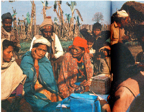
Endlich im Lager! Patienten und Begleiter warten auf die Untersuchung

Wer sind die Patienten, die ins «Eye Camp» kommen, und woher kommen sie? Wer begleitet die Blinden? Wie und von was leben sie? Die durchschnittliche Reisezeit der Patienten zum Schulhausareal in Padnaha betrug