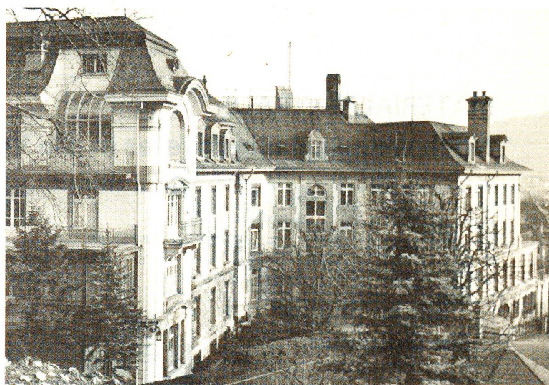
Das ehemalige Gebäude des Lindenhofs, der ersten Rotkreuz-Schwesternschule.