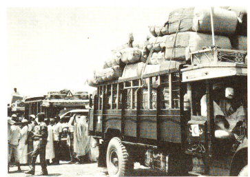
Verteilung von Wollecken: Bei Aktionen dieser Art ist die Atmosphäre äusserst gespannt. Damit die Situation nicht ausser Kontrolle gerät, sind eine straffe Organisation und zügige, gewissenhafte Arbeit ausserordentlich wichtig.

lene, die es schaffen, bis nach Khartum zu kommen, siedeln sich in den Randgebieten der Hauptstadt an und warten darauf, von der Regie-