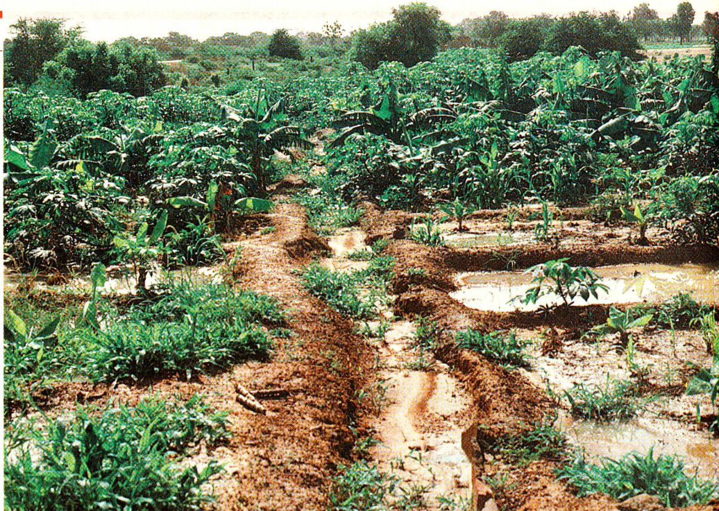
2,5 Hektaren fruchtbares Ackerland konnte das Rotkreuzkomitee in Koulikoro 25 armen Familien zugänglich machen. Die einzelnen Parzellen werden in regelmässigen Turnus mit Wasser aus dem Niger bewässert.

Morry Diarra und seine 14köpfige Familie müssen offensichtlich hart und ausdauernd arbeiten, um überleben zu können. Wenn die Regenzeit, die sich vor kurzem mit ersten Güssen angekündigt