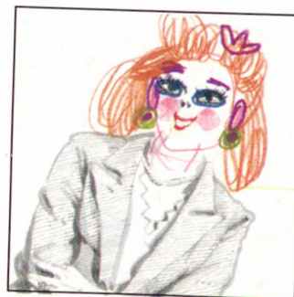
In uns allen lebt noch das Kind, das wir einmal waren. Ihm können Sie begegnen in den Übungen auf den Seiten 9/10 und im Test «Wie kindlich sind Sie?» auf Seite 41.

Bibliographie von Martin Speich LUST AUF MEHR LEKTÜRE? S. 50