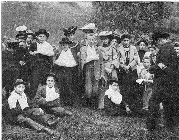
N° 1 er

sanitaire et la colonne de transports auxiliaire récemment créée à Glaris sous le