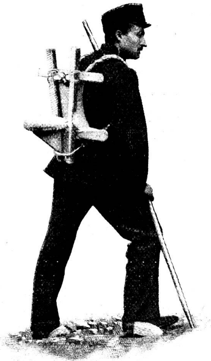
Fig. 3. Le porteur muni de la sellette rembourrée.

Un autre appareil plus complet, plus pratique et qui ménage davantage les forces du porteur ainsi que le confort du blessé, est celui que représente la fig. 3.