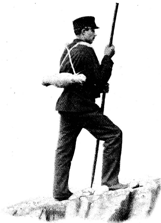
Fig. 2. Le brancardier muni du boudin, prêt à recevoir le blessé.

rembourrée avec de la paille ou du foin, afin de ne pas blesser le dos du porteur, il en est de même des bretelles qui pourraient à la longue contusionner les épaules.