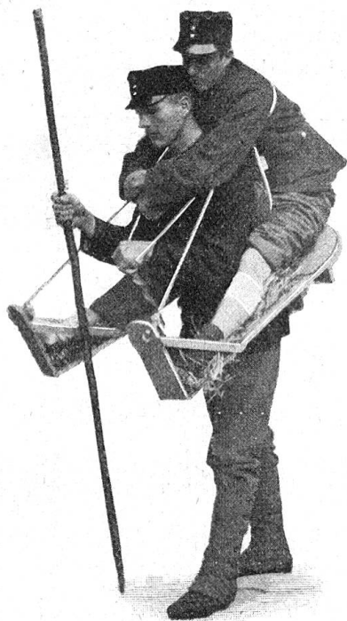
Fig. 5. Transport en montagne sur la sellette en U.

front (qui met en jeu les muscles de la nuque), on facilite la tâche du brancardier; encore faut-il qu'il soit vigoureux et qu'il transporte un blessé léger. A cet égard la meilleure sellette serait peut-être la plus simple aussi, c'est la capote du porteur, le pan en étant fortement relevé sur le dos du blessé et les coins antérieurs roulés, passant sous les bras du blessé,