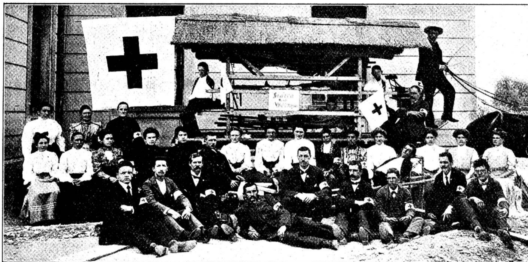
Pl. 4. Les samaritains de Wettingen et le char à blessés qu'ils ont aménagé.

vues que nous reproduisons, de montrer quels genres d'exercices peuvent et doivent être exécutés par les sociétés de samaritains, afin d'encourager les membres de ces sociétés à travailler, et peut-être à