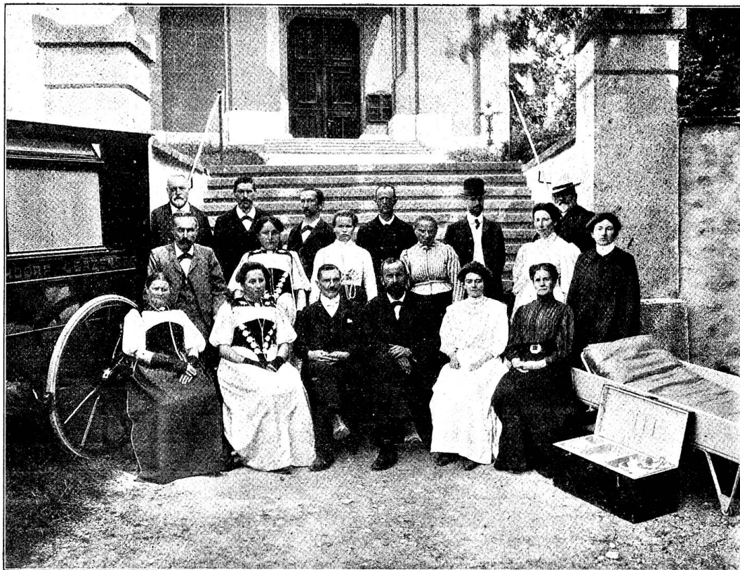
Pl. 3. La nouvelle société de samaritains de Kirchdorf-Gerzensée.

avec la voiture de malades dont cette section a fait dernièrement l'acquisition. Quel-