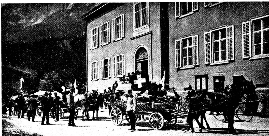
Pl. 2. Arrivée des blessés sur des chars de fortune.

La planche 3 nous montre la société des samaritains de Kirchdorf-Gerzensée