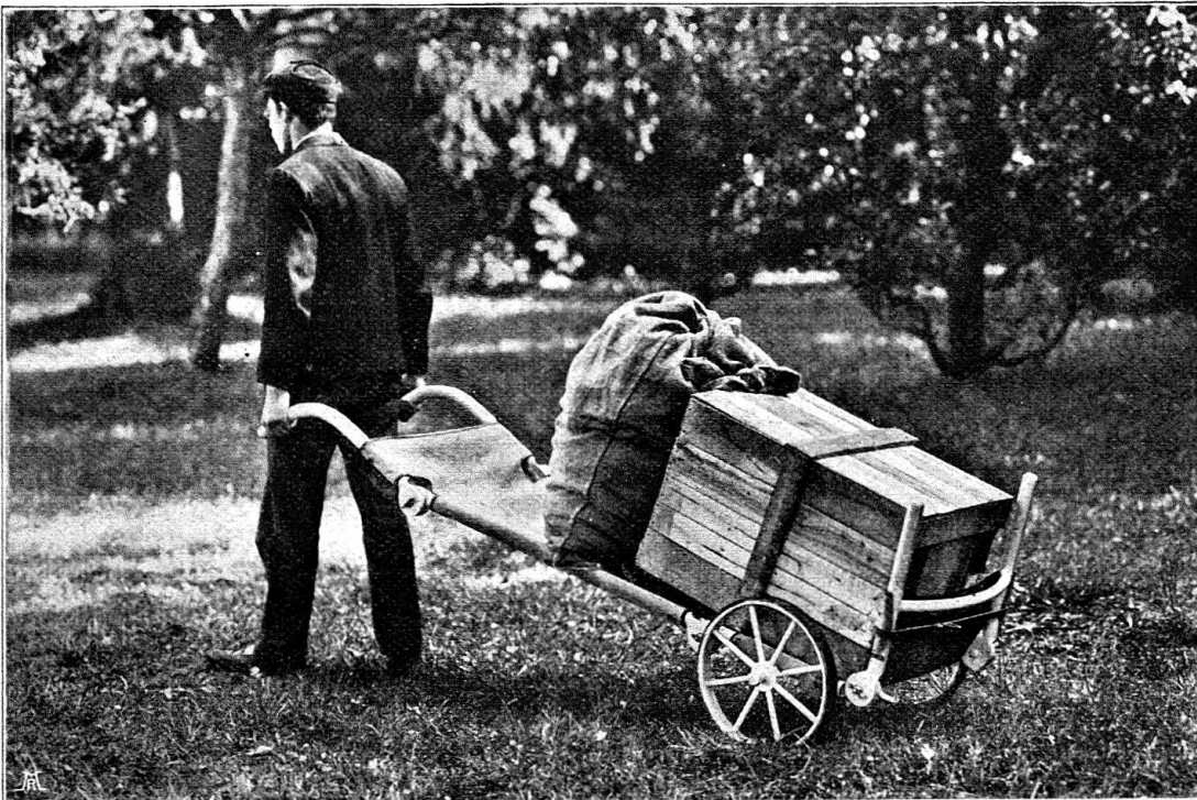
Fig. 4. Transport de matériel lourd, au moyen de la voiturette Riggenbach.

Au lieu de pousser un malade, on pourra se placer dans ce cas comme nous le voyons dans la figure 4.