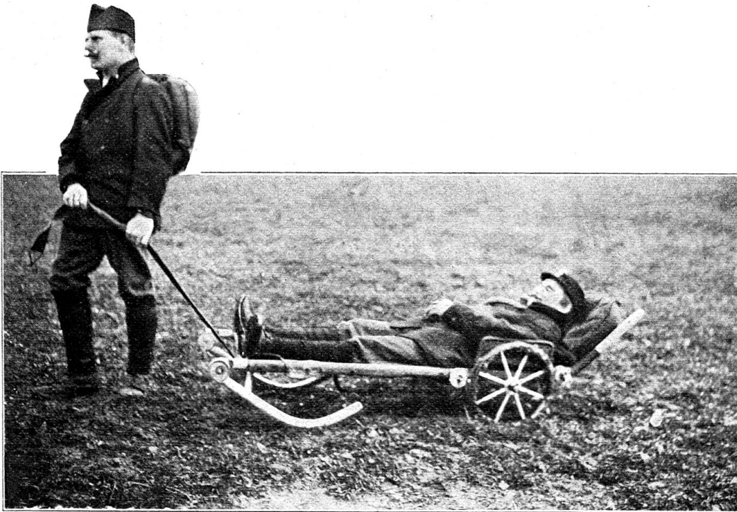
Fig 5. Transformé en traîneau, le brancard Riggenbach peut être tiré par un seul homme.

La figure 7 enfin donne le détail de la construction des rotules. Ces pièces s'emboîtent l'une dans l'autre dans n'importe quelle position du plan vertical, et sont remplies de graisse pour les empêcher de rouiller; soudées aux tiges d'acier, elles sont crénelées dans leurs bords, et ces dentelures, fortement serrées les unes contre