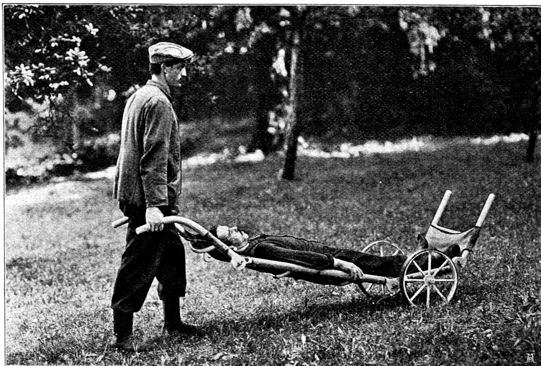
Fig. 2. Transport d'un blessé couché, sur le brancard-roulant Rigggenbach.

La figure 1 nous montre le brancard employé comme civière à porteurs; les rotules crénelées immobilisent les hampes de manière à n'en faire qu'une longue tige d'acier dont l'élasticité permet un