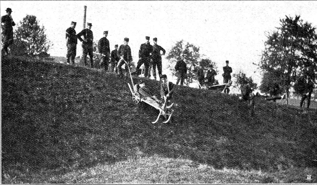
Fig. 6. Descente d'un blessé sur un terrain présentant une forte déclivité.