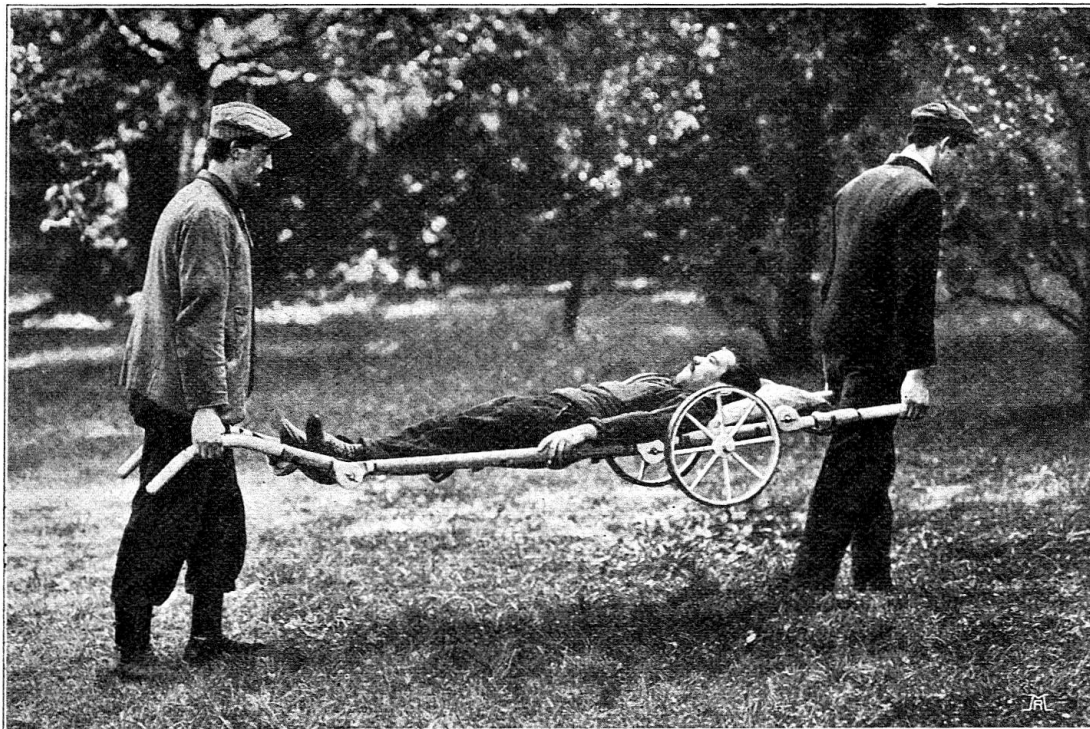
Fig. 1. Le brancard-roulant Riggenschach, employé comme civière ordinaire.

Préoccupé à juste titre de la lenteur et de la difficulté des transports militaires dans la première ligne de secours,