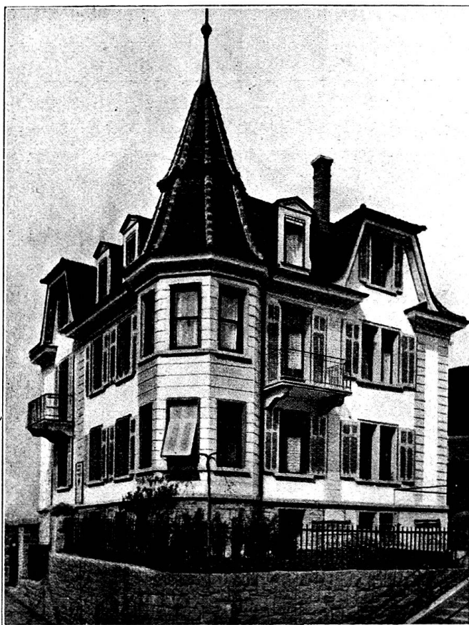
Le Home des infirmières de la Croix-Rouge à Lucerne

commission des transports, donne un aperçu sur les colonnes de transport auxiliaires de la Croix-Rouge suisse. Il en existe 10 aujourd'hui. Il s'agit de les doter de véhicules pratiques pour l'évacuation des malades et des blessés. La commission s'est arrêtée à un modèle de fourgon contenant 10 brancards roulants (voir à