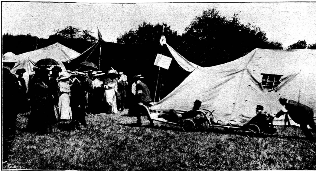
Les tentes montées par les samaritains de Genève, lors de l'exercice du 29 juin

Le cantonnement des samaritains comprenait en outre une cuisine volante dont MM. Buisson et La Chapelle étaient les maîtres-coq. Ils méritent de sincères félicitations; ils ont su préparer un excellent