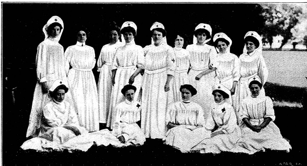
Un groupe de samaritaines-ambulancières de la société de Genève

Il est à prévoir que la première colonne auxiliaire de transports de la Suisse romande sera bientôt constituée à Genève