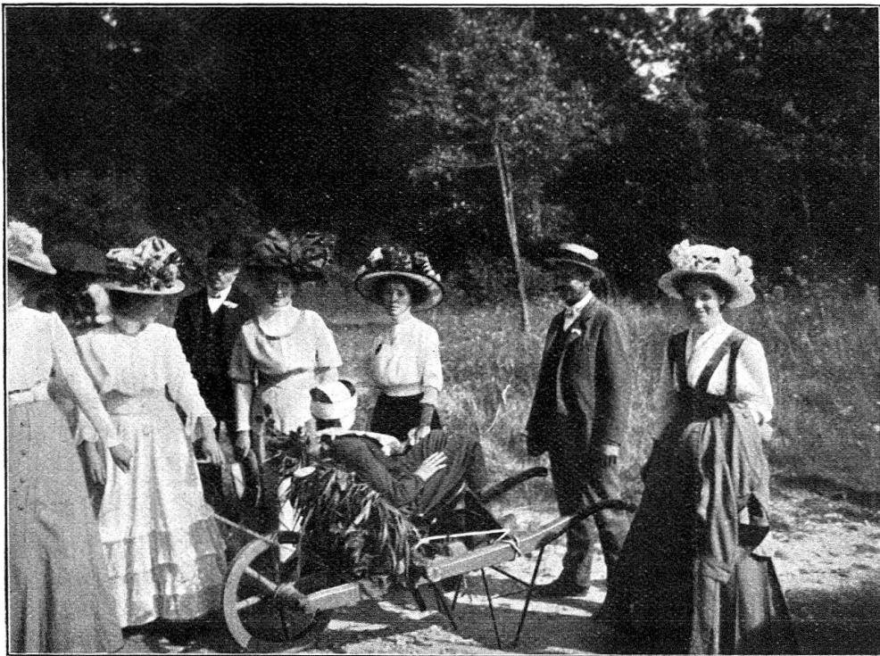
Les samaritains de Fribourg transportent un blessé sur une brouette transformée en voiture à blessés.

porteurs, et 16 relais de brancardiers avaient dû être prévus. Tous les groupes ont travaillé avec beaucoup d'entrain, et ont démontré ce