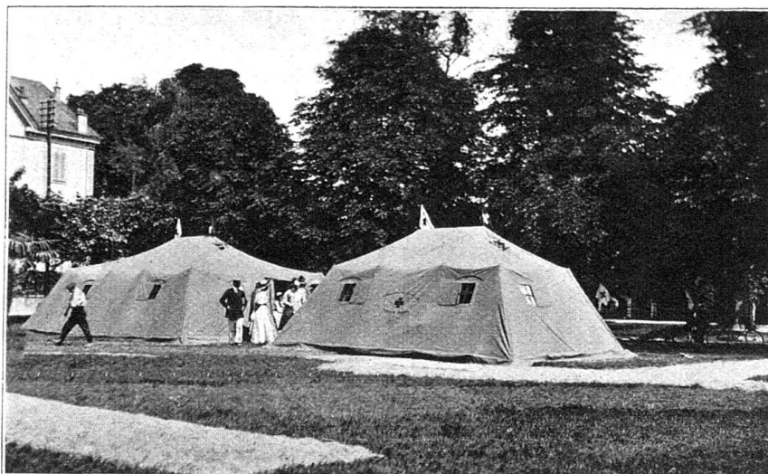
Nouvelles tentes de la section genevoise de la Croix-Rouge, dressées par les membres de la Société militaire sanitaire, section de Genève

miers pansements faits, et les blessés déposés à l'ombre dans un pré, un char à échelles, réquisitionné dans la ferme, fut