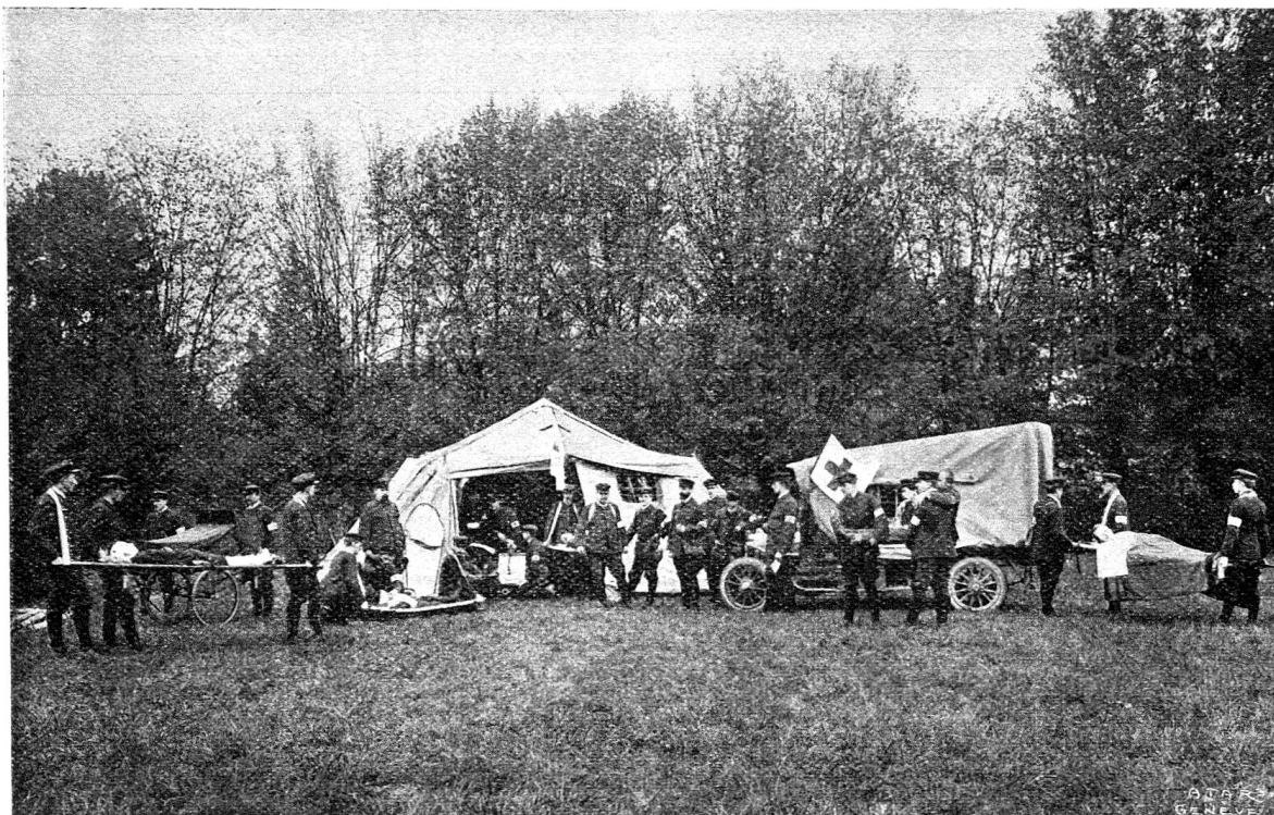
Place de pansement des sauveteurs-samaritains genevois; leur tente de campagne et un camion aménagé pour le transport des malades

Pendant longtemps la Société des samaritains s'est efforcée de créer une colonne de transport auxiliaire, telle qu'elles