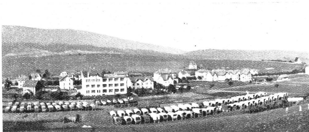
Colonnes sanitaires 3 et 4 Colonne de la Croix-Rouge 5 Colonne de la Croix-Rouge 6

La place de parc du Lazaret de campagne n° 13, près de Soleure