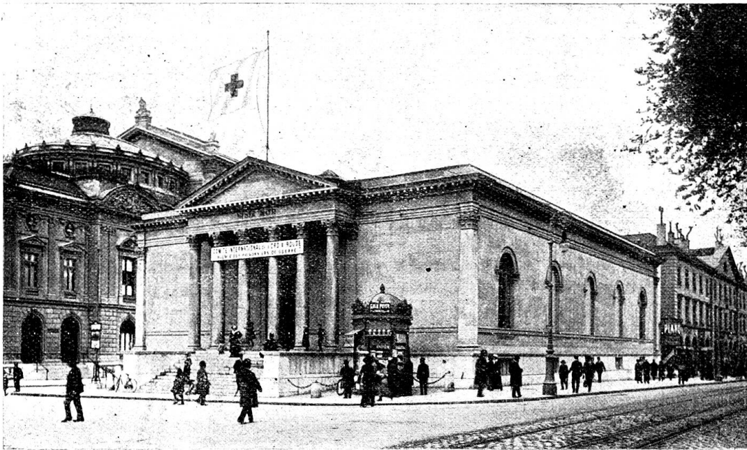
Le Musée Rath, à Genève, siège de l'Agence des prisonniers de guerre

gaise pour assurer, sous le contrôle de Comités nationaux et de délégués neutres, une impartiale distribution des secours de