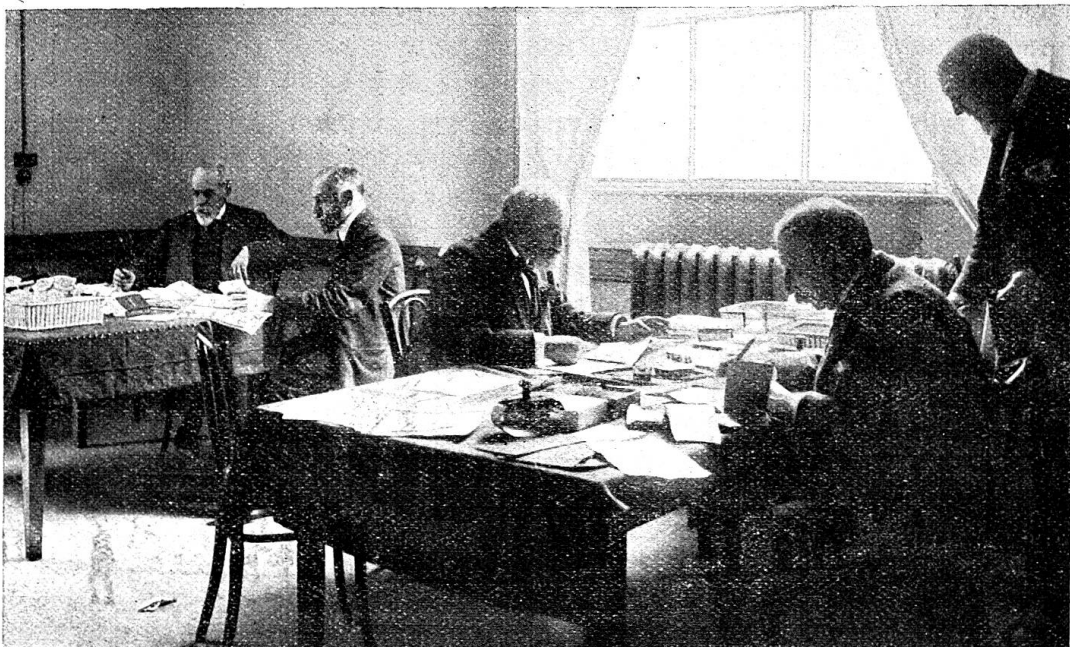
Le cabinet du directeur de l'Agence des prisonniers de guerre à Genève