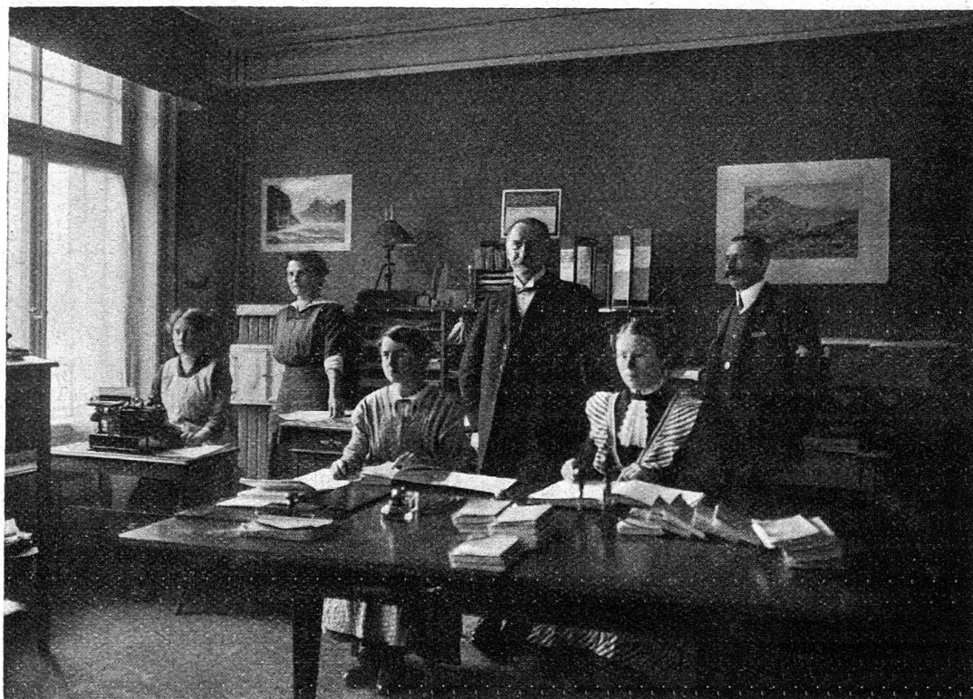
La chancellerie du bureau du médecin en chef de la Croix-Rouge