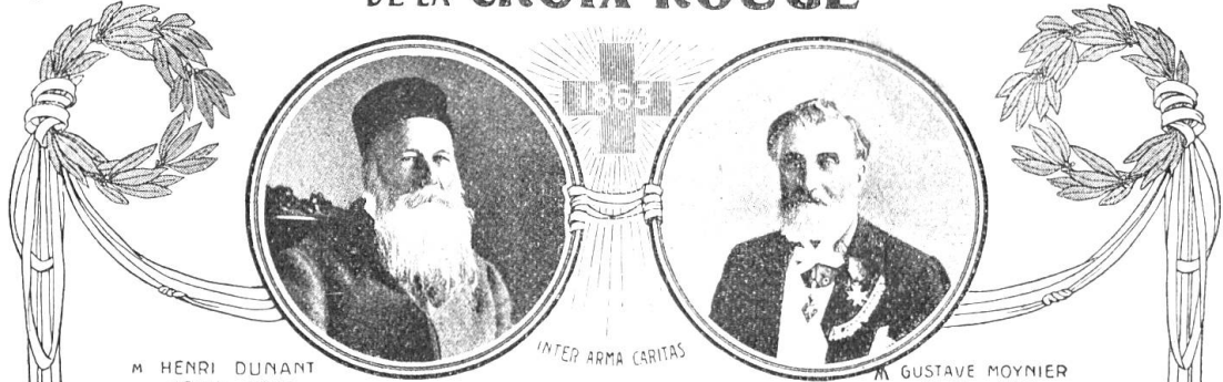
M HENRI DUNANT 1828 - 1910