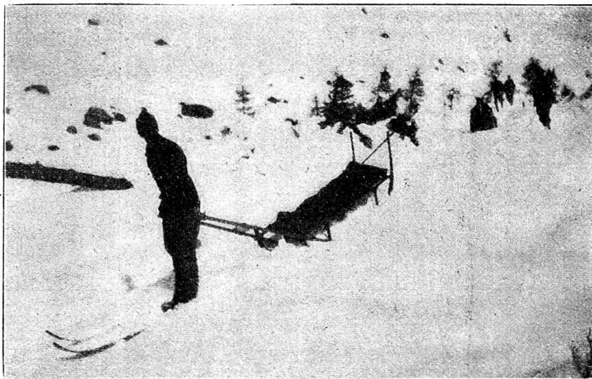
Skieur militaire tirant le brancard chargé

d'origine alimentaire et leurs conséquences sont souvent plus graves que la disette même. En effet, si l'organisme peut s'ac-