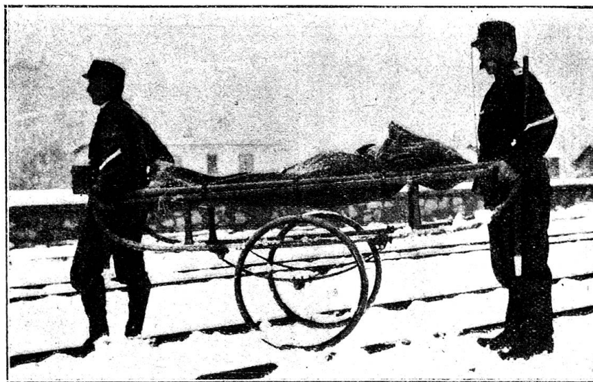
Brancard monté sur roues de bicyclette et muni de ressorts placés sous les skis

Pour ce qui concerne le pain, la question du blutage est encore fort discutée. D'une manière générale, il semble cependant pré-