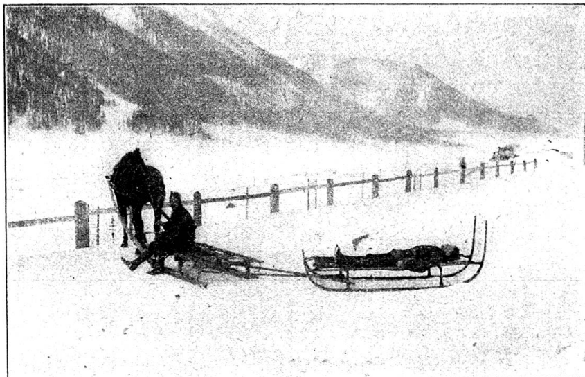
Le même brancard servant au transport attelé

absolument aucune valeur nutritive, son seul rôle est de donner aux aliments une saveur sucrée, de donner l'illusion qu'on mange ou boit quelque chose de sucré.