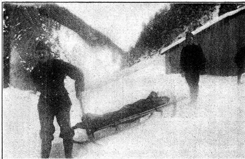
Descente rapide sur le brancard à skis

On peut dire que toute disette se complique presque fatalement d'intoxications