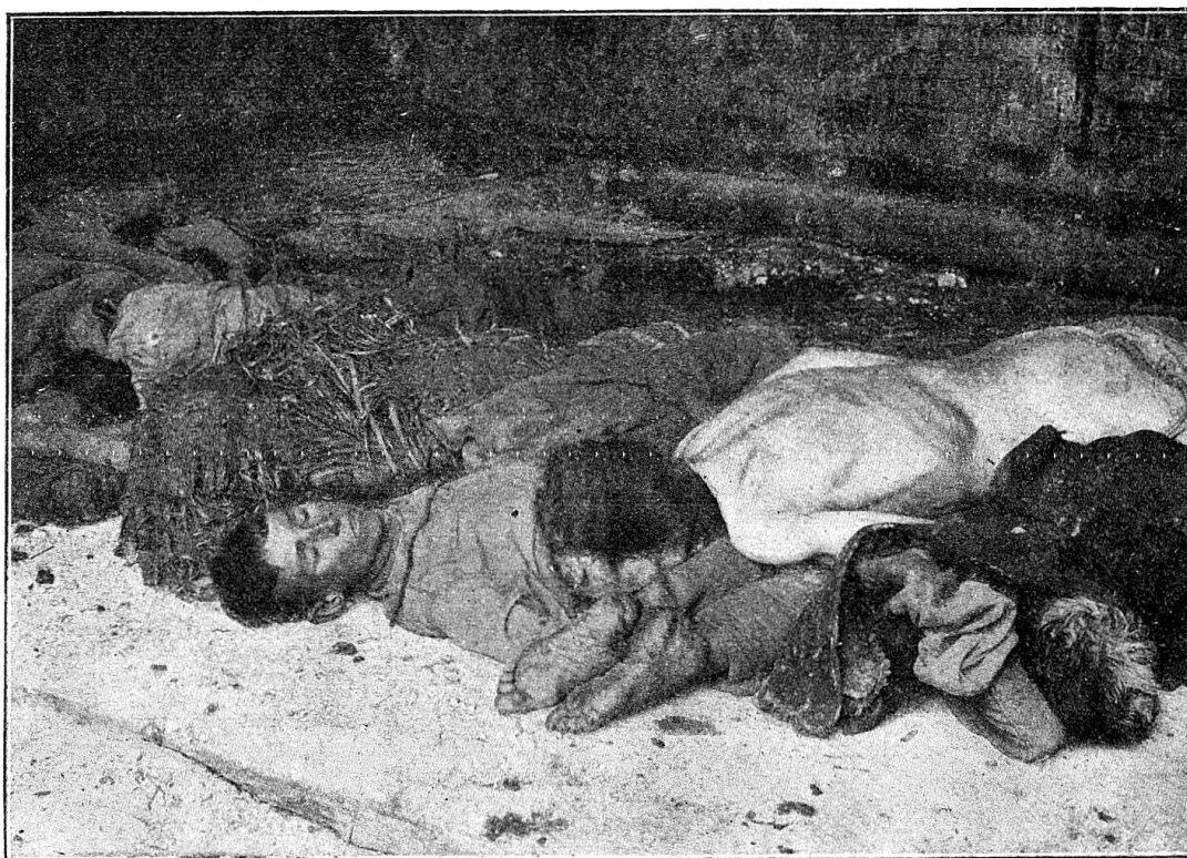
A Orenburg, cadavres abandonnés sur les routes et dans les campagnes.

Nous avons vu au cimetière un tas de 60 à 70 corps qui attendaient d'être jetés dans une fosse. C'était la récolte de deux jours, sans compter les morts enterrés directement par leurs proches. Nous avons vu aussi une fosse pleine de cadavres. Nous avons vu, couchée dans la rue principale, un corps de femme déjà rongé par les chiens (les gens commencent à avoir peur des chiens) . Copeman, des « Friends », nous a dit qu'il sortait rarement de chez