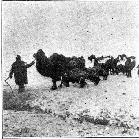
Chameaux du Turkestan achetés par Nansen, destinés à assurer le transport des denrées alimentaires dans les régions affamées.

Après s'être rendu compte des besoins locaux, un ou deux médecins de l'expédition reviendront en Suisse afin d'orienter exactement les directions des deux Comités