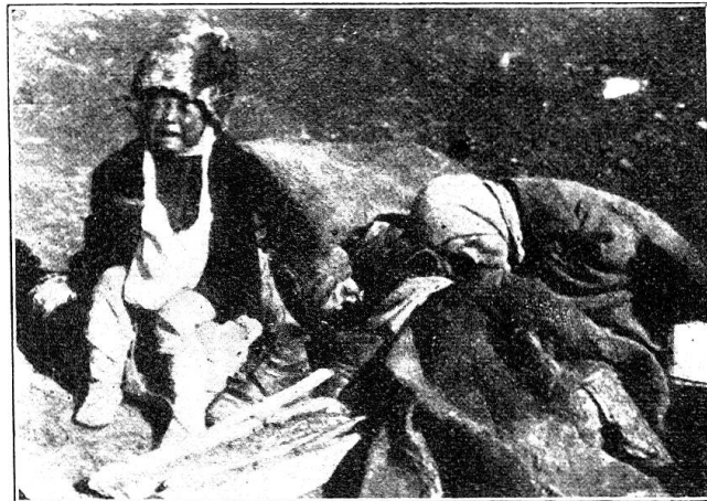
Mère mourante auprès de son enfant, dans la province de Saratov. Tsaritzine, but de l'expédition suisse, est à l'extrémité sud de cette province, à quelque 350 km. de Saratov.

Les denrées transportées en Russie par ce premier convoi comportent en substance: 30 000 kg. de haricots, 6000 kg. de pois, 15 000 kg. de légumes secs, 30 000 kg. de farine, 20 000 kg. de cacao, 5000 kg. de pâtes alimentaires, 750 caisses de lait condensé et de farine pour bébés, 45 000 kg. de riz, 10 000 kg. de graisse, autant de flocons d'avoine et 5000 boîtes de conserves de viande. En outre, 4 fourgons contiennent des dons en nature, spécialement des vêtements.