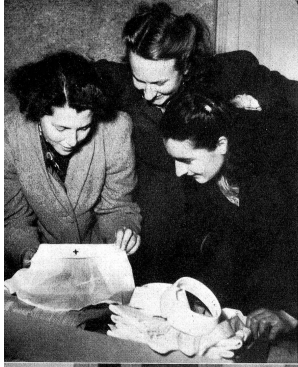
14 h. : Une robe, un bonnet blanc, un col dur, une cravate! Voilà qui marque bien le début d'une nouvelle existence!