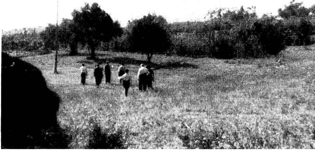
La plaine qui s'étend entre la villa et la montagne.