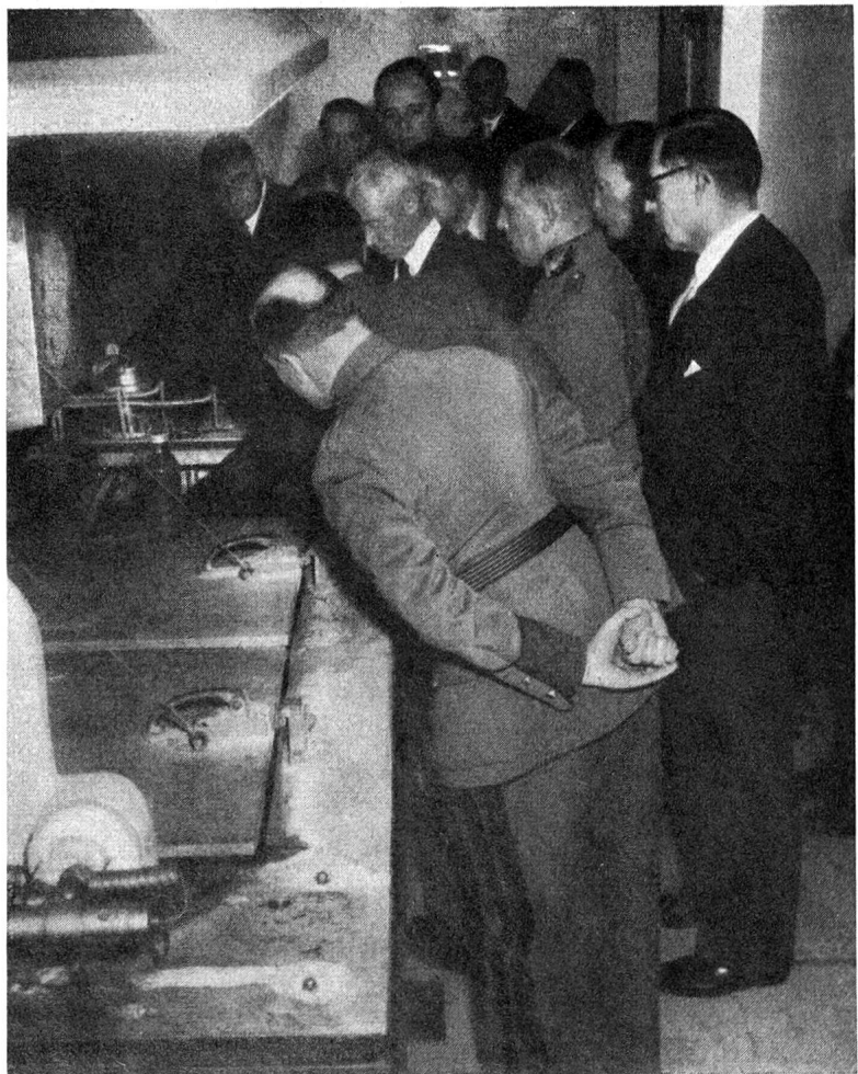
Devant le congélateur rotatif.

On reconnaît: le colonel-commandant de corps de Montmollin, chef de l'Etat-major général de l'armée (de dos), le général Guisan, le colonel-commandant de corps Frick, chef de l'instruction, et M. Kobelt, conseiller fédéral.