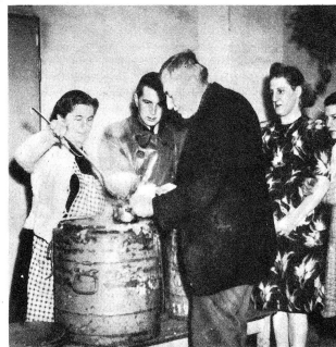
Grâce aux envois de la Croix-Rouge suisse, des soupes sont distribuées aux sinistrés.

des amoncellements de papiers, des appareils téléphoniques et des jeunes femmes qui tapent sur des machines à écrire. Une des parois est entièrement occupée par une étagère couverte d'objets les plus hétéroclites, qui donnent à la pièce un petit air de bazar villageois. Je m'approche.