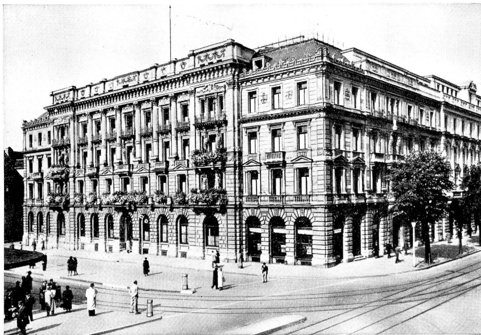
Hôtel de la Banque à Zurich