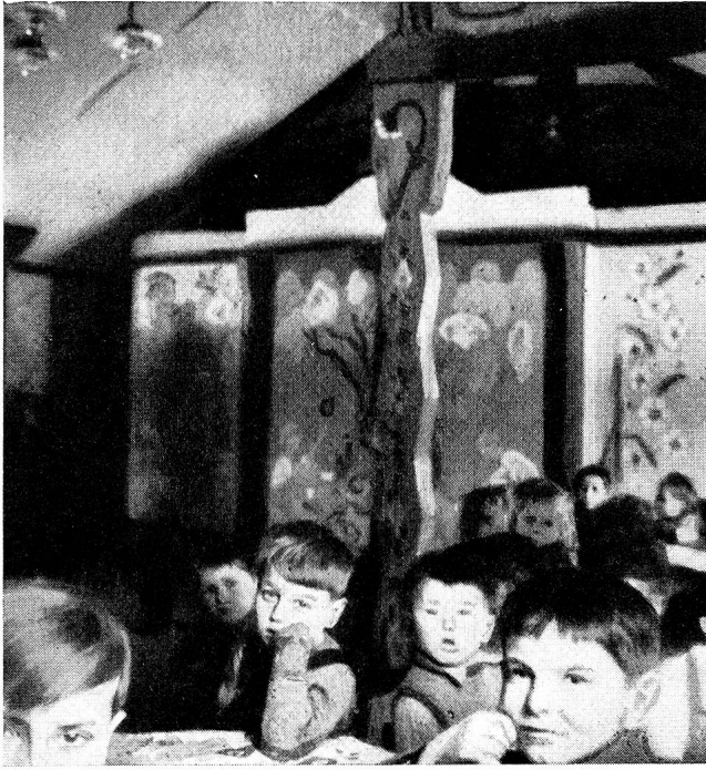
Camp de Kellerberg: le jardin d'enfants russe.

plaisirs, et qui, demain, recommenceront à amasser de l'argent, à s'efforcer d'être plus malins que leurs concurrents, à parader dans les salons. Et je songe à ces hommes, ces femmes, ces enfants, dont j'ai côtoyé, aussi, les autres destins durant ces quelques jours.