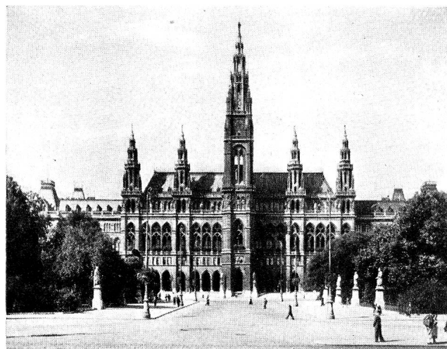
Vienne: les bombes ont épargné l'Hôtel de Ville.

Arrivée à Klagenfurt, au moment où le soleil se couche derrière les montagnes qui marquent la frontière italienne.