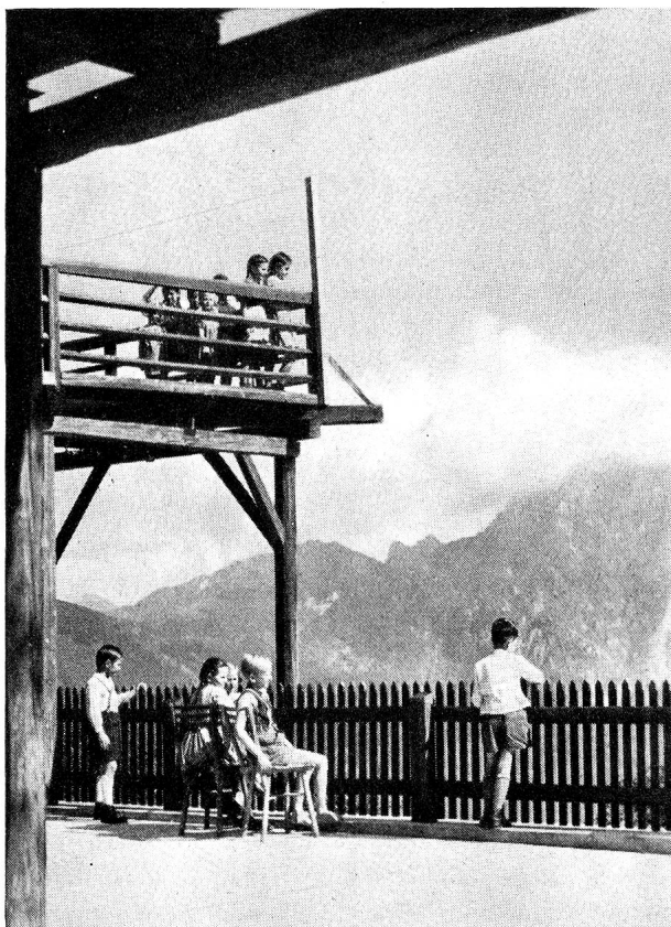
Home du Gmundnerberg: la terrasse.

Au coucher du soleil, traversée en bac du «Beau Danube bleu» (où, diable, Strauss a-t-il vu du bleu?).