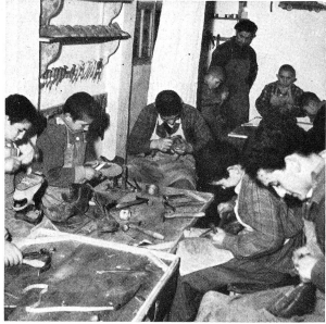
Dans les «Colonies de la Reine», les enfants reçoivent une bonne nourriture, des vêtements propres et en bon état, des soins médicaux appropriés. Ils peuvent également suivre l'école et les plus âgés ont la possibilité d'apprendre un métier, soit dans l'agriculture, soit dans les ateliers de cordonniers, de menuisiers, de couture ou de tissage.

Grâce au «Fonds de la Reine», les enfants des réfugiés, et ceux que guette l'importation de l'autre côté du rideau de fer, ont pu être réunis dans 48 colonies réparties sur tout le territoire de la Grèce. Ces colonies abritent aujourd'hui 45 000 enfants; mais 25 000 autres errent encore sans toit dans le pays, où ils vivent souvent dans la misère la plus complète.