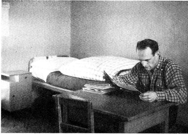
Coin d'un des dortoirs.

A l'exception des affections aiguës et contagieuses, l'établissement accepte tous les cas de maladies et d'accidents pour lesquels le travail peut être considéré comme une thérapeutique à la fois physique et morale: pulmonaires et pleurétiques guéris, asthmatiques, cardiaques compensés, hépatiques, gastro-intestinaux, convalescents de maladies infectieuses, endocriniens, neuro-végétatifs, psychasthéniques, opérés convalescents, suites de fractures, de ménisectomies, porteurs d'affections des oreilles, du nez, de la peau, etc.