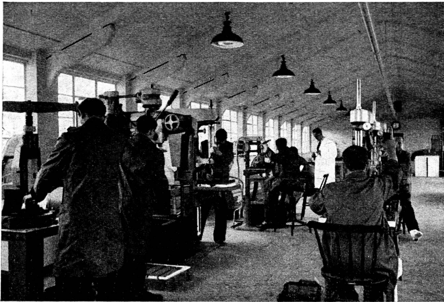
Luton and Dunstable Hospital, Luton. — L'atelier de thérapie par le travail.

Jadis, en effet, le malade bénéficiait durant la période strictement médicale de son traitement de soins allant diminuant au fur et à mesure du progrès de son état pour reprendre ensuite progressivement son travail profession-