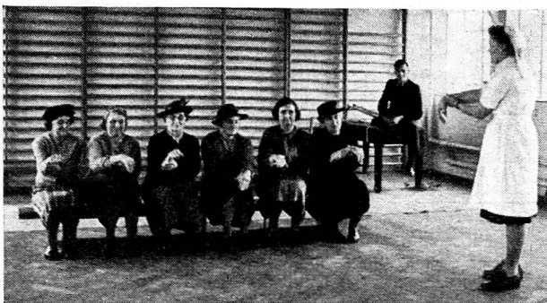
Luton and Dunstable Hospital, Luton. — Exercices de physiothérapie dans l'atelier de gymnastique de l'hôpital.

Le travail de ces deux spécialistes doit être mené en étroite collaboration. Leur intervention doit, de plus, commencer le plus tôt possible, dès l'entrée à l'hôpital, par exemple. Elle doit se poursuivre pendant tout le traitement médical