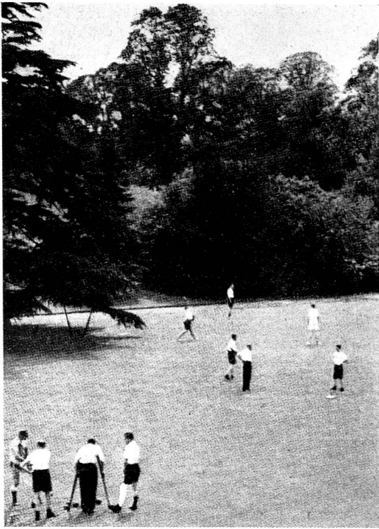
Maison de récupération de Farnham Park, — entraînement dans le parc.

de sa responsabilité personnelle et au moment crucial, surtout, où le malade qui ne s'ignore pas va redevenir le bien-portant qui se cherche.