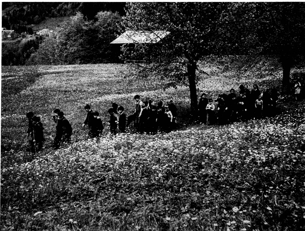
Au préventorium des Alpes, au Beatenberg, d'autres enfants, petits Anglais, petits Romains, jouent de grand cœur.