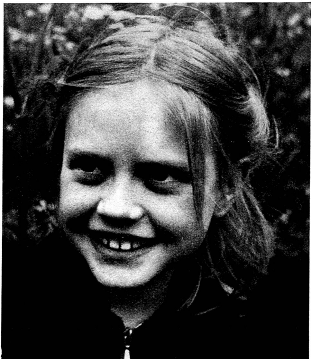
«I like to stay in Switzerland!» dit la petite Anglaise...

Dans les trois maisons que j'ai visitées, les Sœurs directrices, si différentes d'apparence, de caractère, se ressemblent cependant profondément par le même amour, compréhensif et tendre, qu'elles portent aux petits, par l'affection, le respect, la confiance qu'elles ont su éveiller en eux. Et chacune d'elles a su s'entourer d'aides de premier ordre, infirmières, monitrices, jardinières d'enfants. Aussi, chacun de ces homes forme-t-il une vraie grande famille où les trente ou soixante petits qui, de quatre en quatre mois, s'y succèdent trouvent la chaude atmosphère morale et la calme discipline dont ils ont besoin pour que la cure physique à laquelle ils sont soumis porte ses meilleurs fruits, et qu'en même temps se fortifie et s'épanouisse leur petit être psychique, si souvent retardé ou meurtri par les conditions navrantes où ils sont nés et se sont développés.