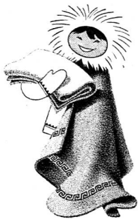
Couvertures de Pfungen