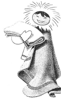
Couvertures de Pfungen