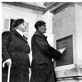
Le monument de Louis Braille.

avait attiré l'attention du monde philosophe et savant, dans sa «Lettre sur les aveugles à l'usage de ceux qui voient», sur la possibilité de leur rééducation; si un Valentin Haüy (1745-1822) avait imaginé le premier une écriture en relief pour les aveugles et entrepris l'œuvre de leur éducation; Louis Braille reste un de ceux qui auront le plus et le mieux servi la cause des invalides frappés de cécité et contribué à les rendre à une vie et une activité sociales.