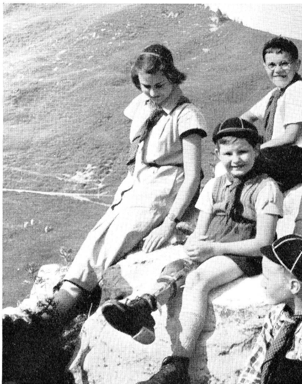
Malgré son appareil orthopédique, ce petit louveteau connaît aussi la joie des camps.

sables, un caractère impossible et des manières désagréables!