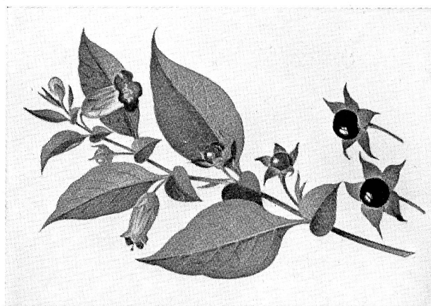
La dangereuse belladonne avec ses jolies fleurs rougeâtres et ses appétissantes baies noires.

Les plantes médicinales contiennent souvent des principes actifs d'action assez énergique qui leur confèrent une toxicité non négligeable. Le fait que de nombreuses personnes récoltent