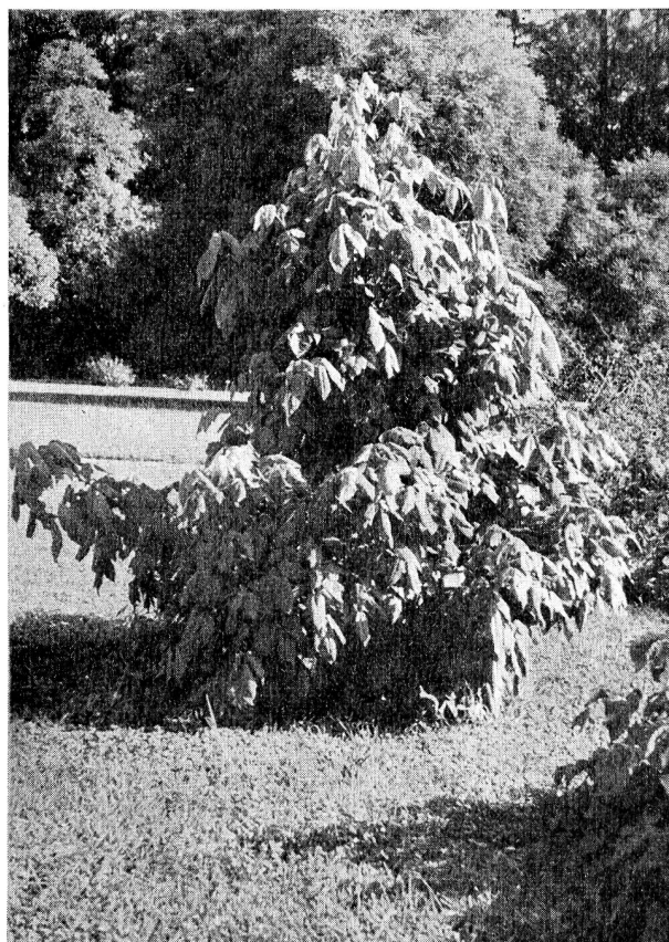
Le Sumac vénéneux ( Rhus Toxicodendron L.) du Jardin botanique de Genève. Le Rhus , vulg. Poison Ivy (Lierre vénéneux) ou Herbe à la puce, est une des plantes les plus redoutées aux Etats-Unis et au Canada. Introduit en Suisse à titre médical semble-t-il, il a provoqué à plusieurs reprises des dermatoses. Cf. Le Sumac vénéneux, par Rd. Weibel, «Journal des Musées», Genève oct. 1950.

A ces deux groupes on pourrait encore ajouter les plantes qui sont toxiques pour les