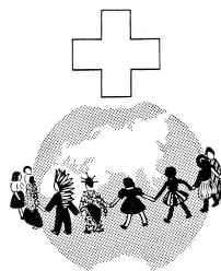
RENCONTRE INTERNATIONALE DES JEUNES DE LA CROIX-ROUGE CHATEAU DES MESNULS