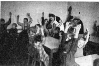
Au camp Henri Dunant: le jardin d'enfants.

Et puis, tout près, l'église du Souvenir, au milieu de l'ancienne place débaptisée, dresse dans la nuit son lourd clocher 1900 décapité et les arches béantes de sa nef éventrée, pendant que des rues entières ont disparu entre le Zoo et la place Wittenberg.