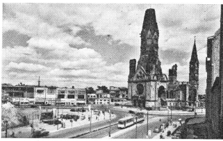
Les ruines de l'église du Souvenir de l'empereur Guillaume et le Kurfürstendamm.

devenit un parc où les nouvelles plantations d'arbres et les avenues se dessinent à nouveau. Le Zoo a retrouvé son calme et ses visiteurs ainsi que ses bêtes, et l' Aquarium ses cuves et l'admirable joaillerie des poissons exotiques. Des broyeuses géantes réduisent en poussière des millions de briques écornées ou cassées des bâtiments détruits que leur amènent d'innombrables camions, et leur poussier clair s'amorce en gigantesques collines où se dessinent déjà les allées et les bosquets des parcs futurs de la grande ville de demain.