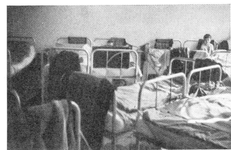
Camp Henri Dunant: un des dortoirs.

Tous ceux qui ne reçoivent pour toute assistance, comme les chômeurs, comme les réfugiés, que quelque 80 marks de secours par mois, quelque 75 ou 80 francs suisses. La vie est elle meilleur marché à Berlin qu'en Suisse? Elle nous le paraît certes de prime abord, sinon pour quelques denrées comme le tabac ou le café. L'inflation a su être évitée, la leçon de 1918 et de la valse funambulesque et tragique des milliards, des billions et des trillions des marks d'alors, n'a pas été perdue. Le pennig garde sa valeur mieux que centime de Suisse ou franc de France, et l'on mange bien pour 2 marks et demi ou