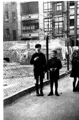
Enfants réfugiés dans la cour d'un camp berlinois.

Graves, émus, nous emplissons le bol de terre jaune puis, sur le fond d'étoiles à présent